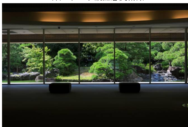
＜西宮市大谷記念美術館＞