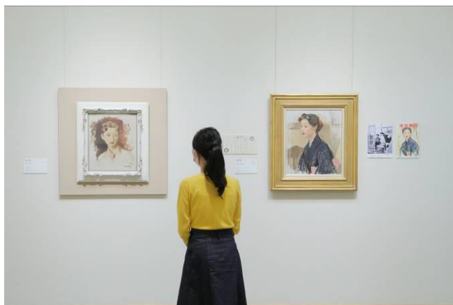
＜神戸市立小磯記念美術館＞