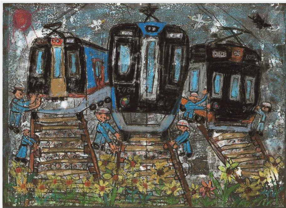
橋本 英明さんの作品

受賞のポイント：全体に絵の印象は重たく暗い印象を持たれる方もいらっしゃるでしょう。雰囲気があり、空気感というか匂いが伝わってきます。全体バランスがとても良いです。5700系を中心に1000系、9000系をしっかりと描いています。そして車両保守、保線の人たちの優しい表情。画面下部にはお花を、上部には空と鳥を描いてくれました。見る人が「リアル」だと感じるのは形よりも質感だと感じさせてくれた作品です。もはやお絵描きではなく絵画芸術です。