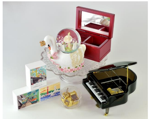
神戸オルゴール ケース例

【注文方法】 ミュージアムショップ時音(とおん)ONLINE(楽天市場店)よりお申込みください。