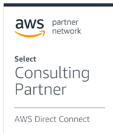
「AWS Direct Connect サービスデリバリープログラム」 認定バッジ

この度、アイテック阪急阪神が提供する「i-TEC クラウドコネクト」は、高品質で高速、かつセキュアに、AWS との接続を実現します。加えて、東京と大阪2拠点からの専用接続と、アイテック阪急阪神が保有するフル冗長化構成のネットワークにより、障害に強い接続が可能となります。