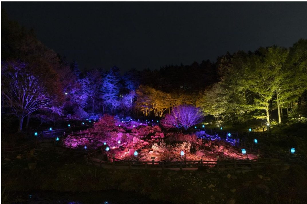
高橋匡太《Glow with Night Garden Project in Rokko 提灯行列ランドスケープ》六甲ミーツ・アート 芸術散歩 2019 開催時の様子

これらの施策を通じて、神戸・六甲山、有馬エリアの夜観光の活性化を促進して参ります。