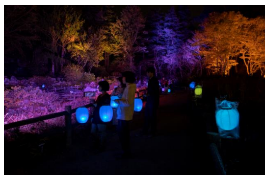
高橋匡太《Glow with Night Garden Project in Rokko 提灯行列ランドスケープ》2019年