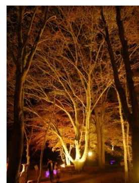
六甲高山植物園 紅葉ライトアップの様子

【料金】 「六甲ミーツ・アート 芸術散歩 2020 鑑賞パスポート」または「六甲高山植物園 大人700円、小人350円」の単施設入園券