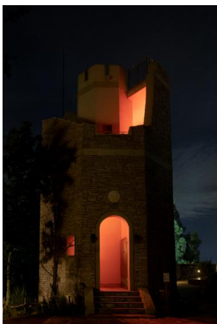
コリー・フラー《Lighthouse》2020年