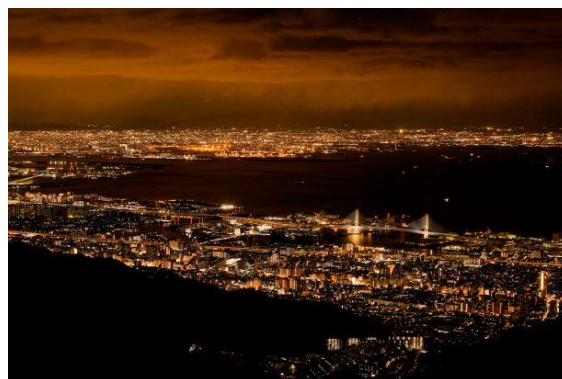
「1,000万ドルの夜景」と称される六甲山からの夜景

【申込み】 https://www.rokkosan.com/tabi/tour/252