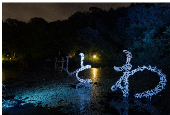
伏見雅之《過去とほどこか》2020年