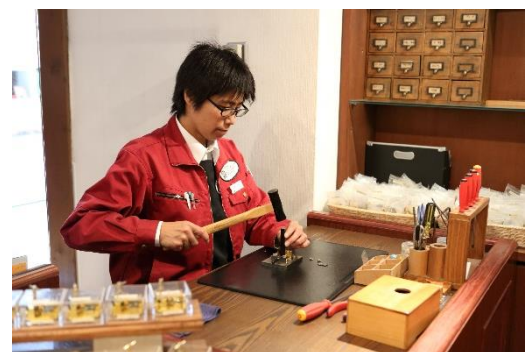
神戸オルゴール 職人が組み立てる様子