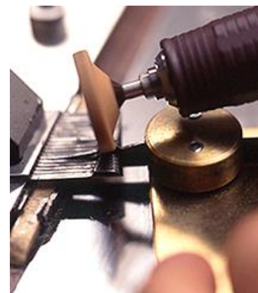
神戸オルゴール 櫛の調律の様子