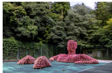
木村剛士《戻れない、過去に浸る日もあっていい》 2020年 サテライト会場:有馬温泉エリア