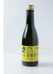
アフタヌーンティーセット(やまみつパイ・レモネード)