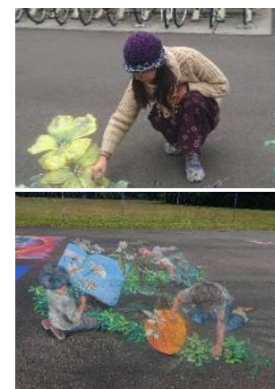
「Garden of Wander」2019年 Sarasota Chalk Festival 2019/Venice Airport

2019年 Premio Speciale Opera Segnalata 2017年 Premio Speciale Opera Segnalata 2006年より、イタリアにてマドンナーラの活動を開始。 2008年より日本での活動を開始し、国内外のフェスティバルで路上に絵を描いている。ワークショップや自由参加形式で子ども達との共同制作も多く実施。