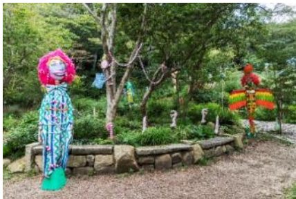
秦まりの《MAHOU NO MORI》 2019年 六甲オルゴールミュージアム