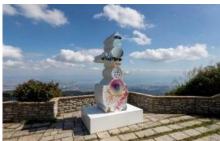
植松琢磨《world tree II》 2019年 六甲ガーデンテラス

六甲山のエリア特性をじっくりと読み込み、自然や景観、歴史を採り入れた作品を各会場に展示します。