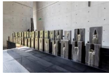
榎忠《End Tab (エンドタブ)》 2019年 風の教会