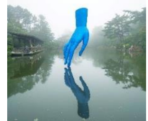
「やさしい手」 六甲ミーツ・アート芸術散歩 2018