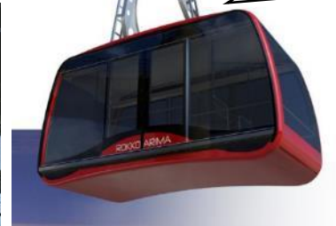
六甲有馬ロープウェー