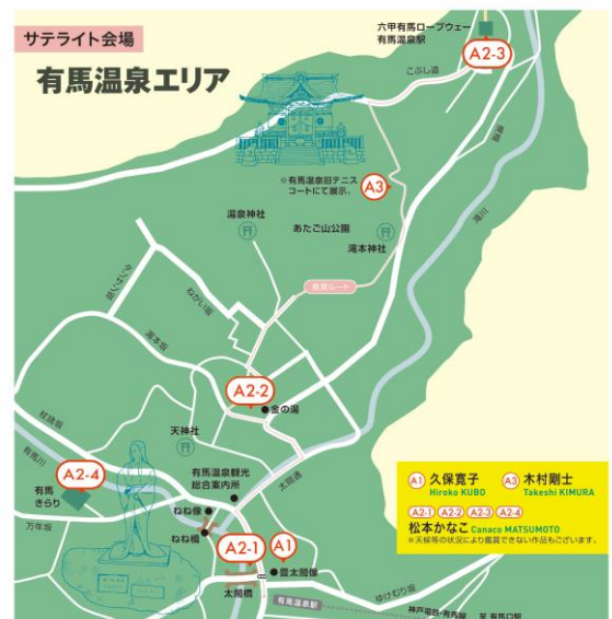
サテライト会場 有馬温泉エリア 作品マップ