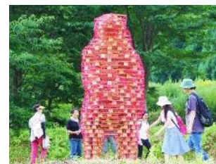
「Bearer of a message」2015年 大地の芸術祭 KAMIKOANI PROJECT AKITA2015/秋田