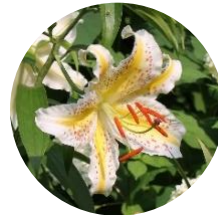
ヤマユリ (7月下旬～8月上旬)