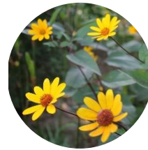
ヘリオプシス (7月中旬～8月上旬)