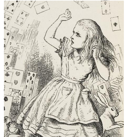
ジョン・テニエル『不思議の国のアリス』 挿絵(部分)1865年 画像提供

【使用楽器例】 ポリフォン54型“ミカド”(ディスク・オルゴール/1900年頃/ドイツ)他