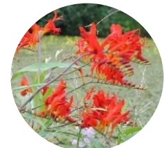
クロコスミア (7月下旬～8月上旬)

六甲オルゴールミュージアムでは、六甲山の自然と調和したイングリッシュガーデンをコンセプトに植栽を行い、約300種類の四季折々の樹木や花々を見ることができます。池の側に設置されたベンチに座って、鳥のさえずりに耳を傾けるなど、ゆっくりとした時間が過ごせます。