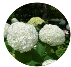
アメリカアジサイ (7月中旬～8月上旬)