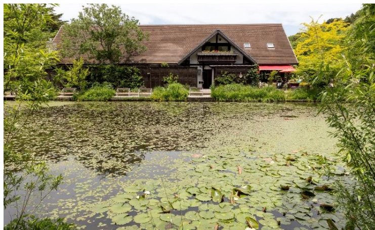
コンサート会場から見たミュージアムガーデン「ヒツジグサの池」の様子