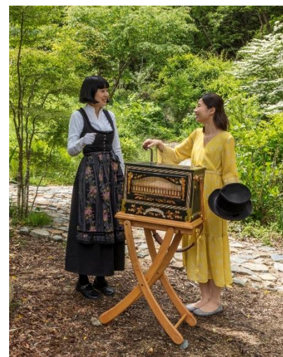
手回しオルガン演奏体験の様子(イメージ)