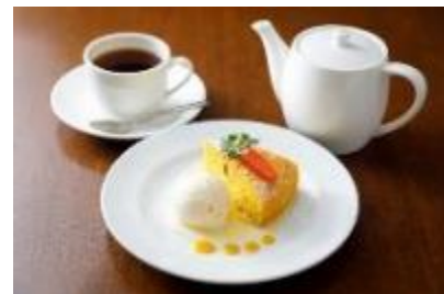
キャロットケーキ(ドリンク付)

にんじんたっぷりの生地に、ドライフルーツを練りこんだ、イギリスの家庭で作られる伝統的なケーキです。