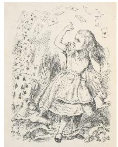
ジョン・テニエル『不思議の国のアリス』挿絵1865年

英ヴィクトリア朝を代表する風刺画家の1人。風刺漫画雑誌『パンチ』の人気画家として活躍。『不思議の国のアリス』の挿絵作家としても知られ、後世の『アリス』の挿絵に多大なる影響を与えた。1893年に風刺画家として初めて「ナイト」の称号を授与される。