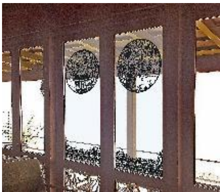
ウィンドウアート イメージ