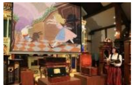
上演の様子(イメージ)

【使用楽器例】 ポリフォン103型(ディスク・オルゴール/1900年頃/ドイツ)他