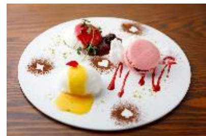
チーズ・ベリー・柑橘のデザート3種盛