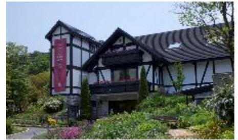
六甲オルゴールミュージアム

※新型コロナウイルス感染症の状況により、臨時休館、イベント内容を変更する場合があります。最新情報はホームページをご覧ください。