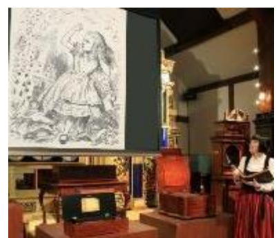
上演の様子(イメージ)

アーティストのイラストや映像に、オルゴールなどの自動演奏楽器の演奏を加えたライブ感あふれる上演スタイルを、当館では「オルゴールシアター」と称しています。これまで、版画、サンドアート、影絵などと共演しており、他にはない当館独自の企画としてシリーズ化しています。