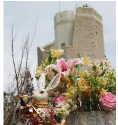
六甲ガーデンテラス「アリスガーデン」の設え(イメージ)

※7月20日(月)以降、変更の場合がございます。 ※六甲ガーデンテラスの営業時間は店舗により異なります。