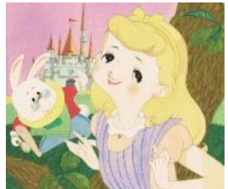
松本かつぢ 絵本『ふしぎの国のアリス』より (1962年)

松本かつぢが描く、ふんわりとした優しい色合いのアリスの世界を、視覚だけでなく聴覚も使って鑑賞することができます。