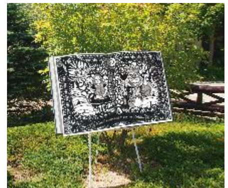
巨大絵本 イメージ