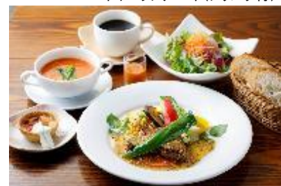
牛サーロインステーキ やまみつマスタードソース

フロマージュブランのムースとフランボワーズのマカロン、瀬戸内レモンシャーベットの3種の味わい豊かなデザート。見た目もかわいく女性におすすめの季節デザートです。