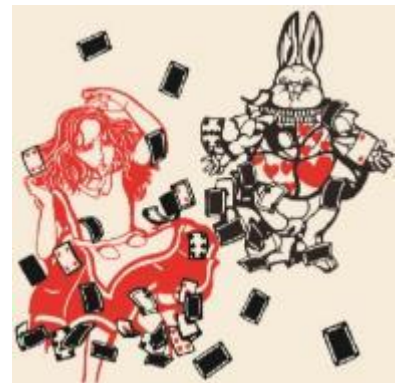
スタンプラリーイラストイメージ

【プレゼント引換場所】 六甲オルゴールミュージアム受付 ホルティ(六甲ガーデンテラスエリア内)