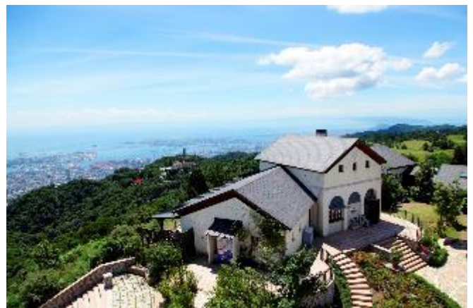
六甲ガーデンテラス