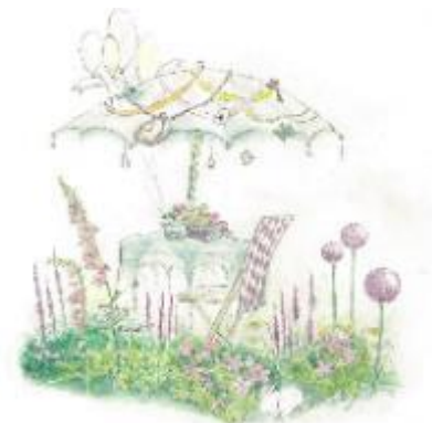
アリスガーデン イメージ

また、エリア各所では、切り絵作家、下村優介による『アリス』をテーマにした巨大絵本やウィンドウアートなどを展示します。標高888mの解放感溢れるエリアで、『アリス』の世界が楽しめます。