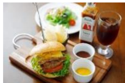
スティルトンチーズバーガー(ドリンク付)