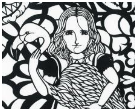
下村優介切り絵作品(部分)2020年