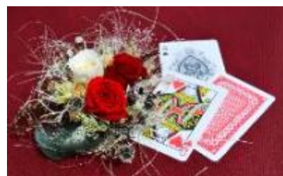
バラのコサージュ(イメージ)

※イベント当日は10:30～、11:30～、12:00～のオルゴール組立体験を中止します。