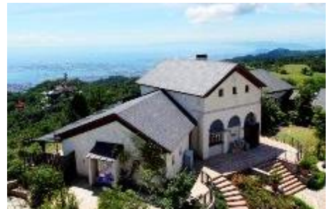
六甲ガーデンテラス