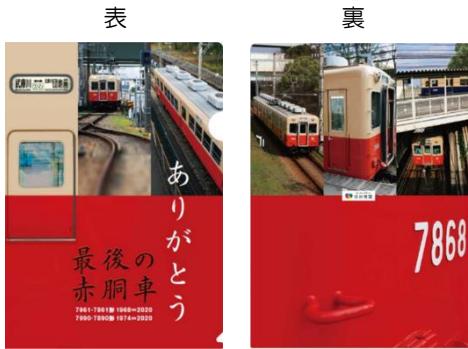
(1) ありがとう赤胴車クリアファイル