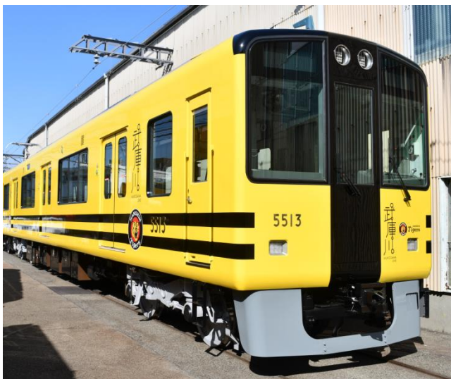
タイガース号の外装

なお、武庫川線での運行開始日及び現在改造工事中の残りの編成のデザインテーマにつきましては、後日お知らせします。