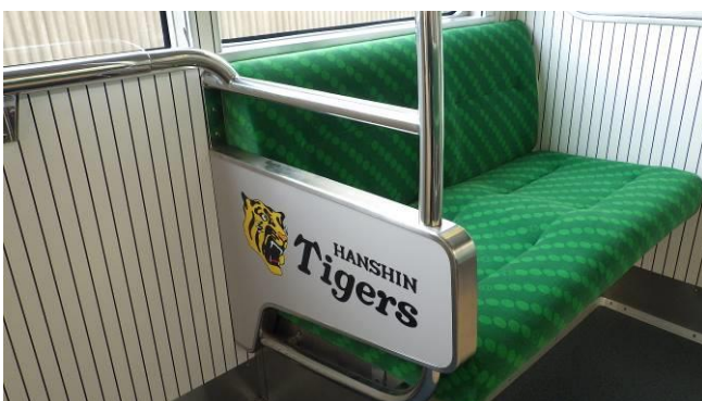
タイガース号の内装