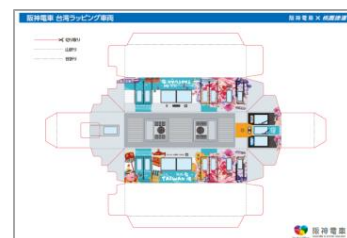
<ペーパークラフト>