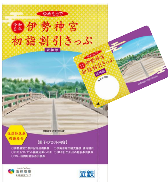
阪神版「伊勢神宮初詣割引きっぷ」

これらの便利でお得な初詣きっぷで、伊勢神宮をはじめ阪神・近鉄沿線の初詣・初旅にぜひお出掛け下さい。