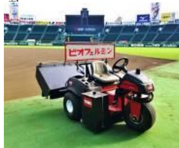
グラウンド整備カー