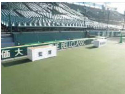
高校野球インタビュー台