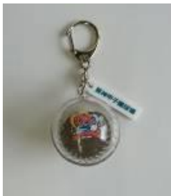
甲子園の土キーホルダー