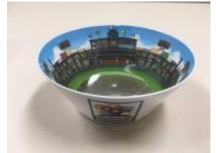
阪神甲子園球場95周年ボウル