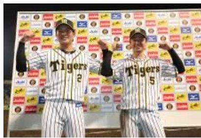
ヒーローインタビューお立ち