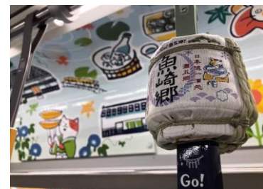
菰樽(こもだる)つり革