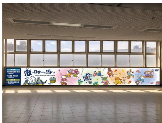
魚崎駅の装飾イメージ