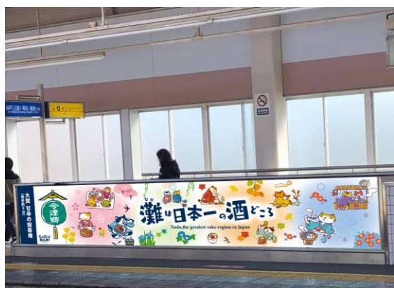
今津駅の装飾イメージ

この駅装飾を目にさせていただくことで、各駅の近くに酒蔵があることを知っていただくとともに、灘の酒蔵巡りへの興味の喚起を図ることを狙いとしています。