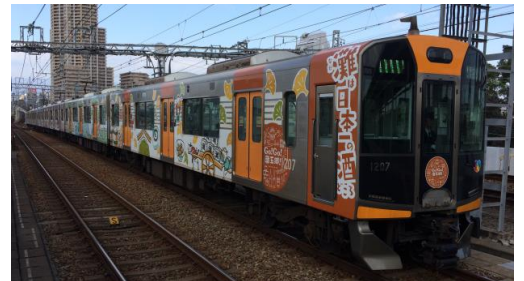
ラッピング列車「Go!Go!灘五郷!」