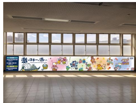
駅装飾のイメージ