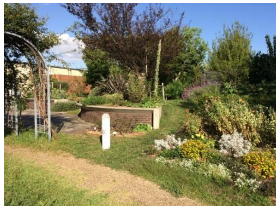
〈芦屋市総合公園（芦屋市）〉