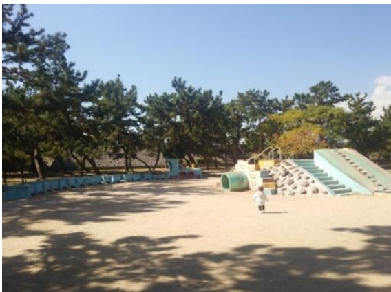
〈浜甲子園運動公園（西宮市）〉