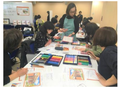
塗り絵体験講座の様子