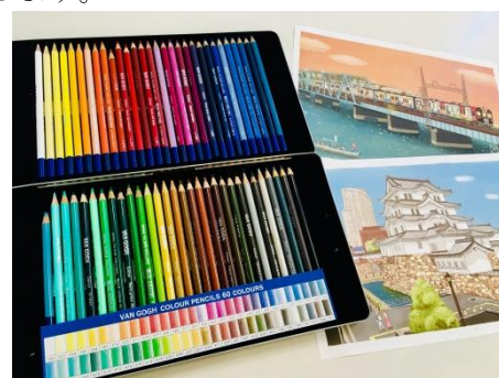
<ヴァンゴッホ色鉛筆60色セット>