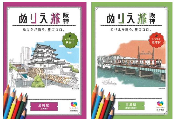
＜『ぬりえ旅 阪神』表紙イメージ＞

塗り絵のイラストは、神戸を中心に活躍し、やさしいタッチで定評のある「もふもふ堂」が担当しています。