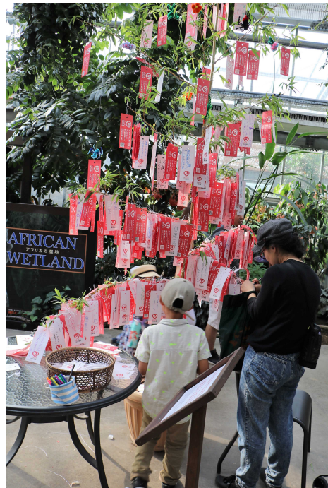
神戸どうぶつ王国