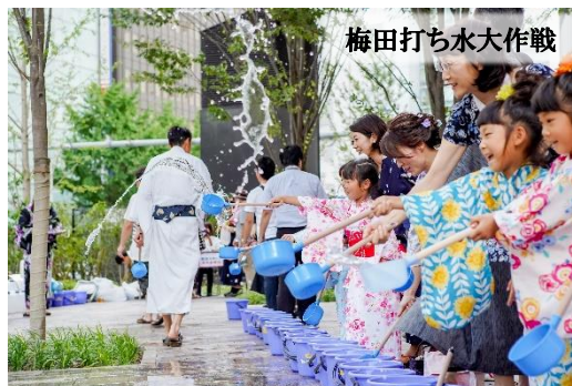
梅田打ち水大作戦

ゆかた姿で夏を満喫する！ゆかた祭を満喫する！写真を SNSで投稿頂いた方から抽選で素敵な賞品をプレゼント。