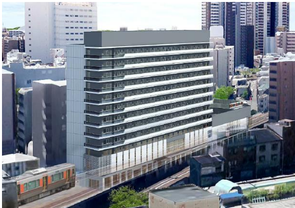
▲本施設の外観イメージ