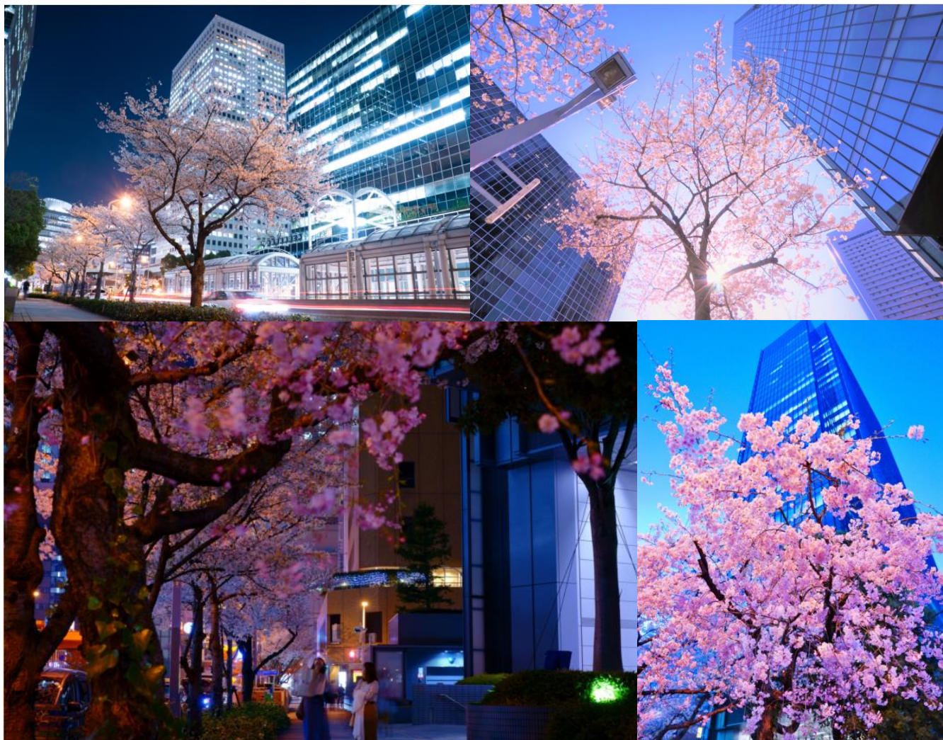
<昨年の優秀賞作品の一部>

今回開催する「大阪ダイヤモンド地区 さくらフォトコンテスト2019」の概要は、別紙のとおりです。