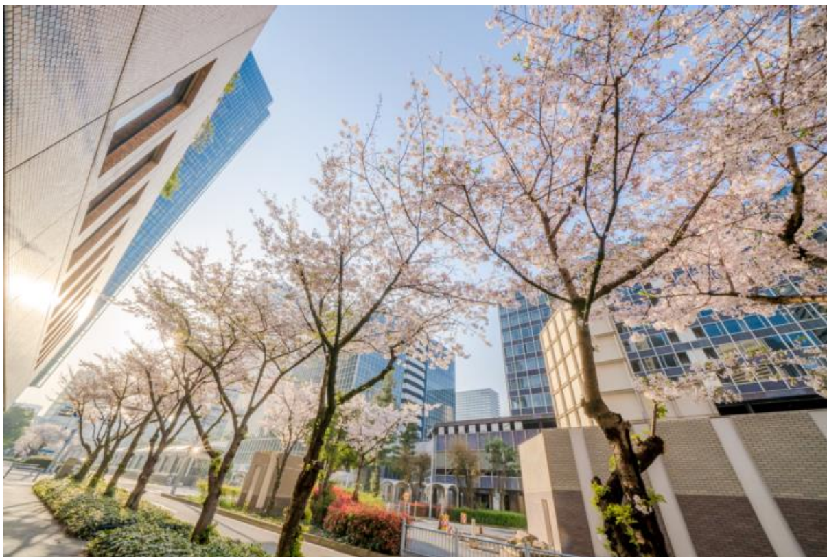
<昨年の最優秀賞作品>

今回で3回目を迎えるこのコンテストは、美しい桜があふれる大阪ダイヤモンド地区の高層ビル群と自然の美しい調和を写真に収めていただくというもので、地下街が発達している梅田地区にあって、日ごろ地下を歩いている方にも、『都会の真ん中に咲いている桜』だからこそその魅力を感じて地上を歩いていただき、改めて、同地区の魅力を多くの方々に発見してもらおうというものです。昨年からはInstagramでの応募も開始し、徐々に地区イベントとして定着しつつあります。