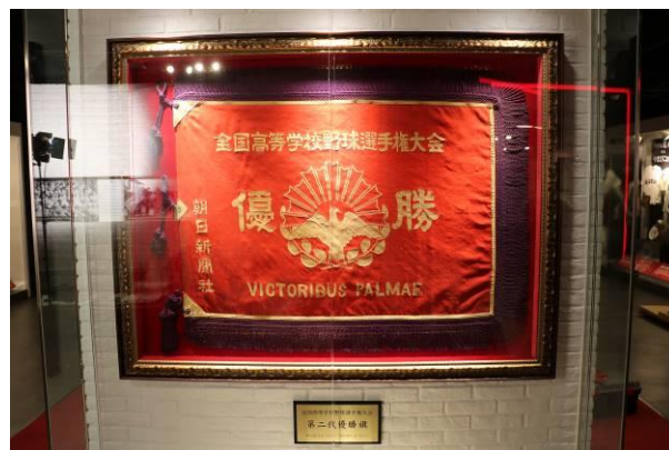
展示写真（イメージ）