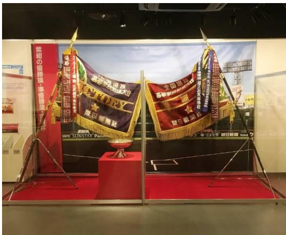
選抜高等学校野球大会の優勝旗（展示イメージ）