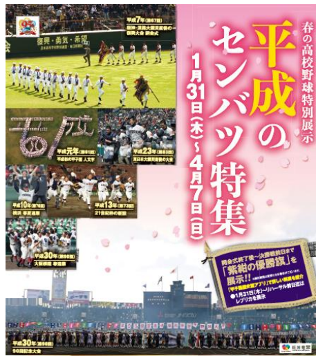
企画展ポスター（イメージ図）