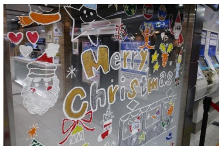
&lt;駅長室ガラス面への装飾 (昨年作品) &gt;