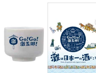
ノベルティグッズ

情報発信の効果を高めるとともに、灘五郷への誘客を図るため、ノベルティグッズを作成し、各種のイベント等で配付します。