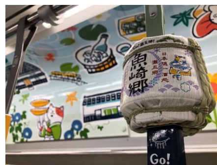
菰樽（こもだる）つり革

小さな菰樽は、見た目もチャーミング!お気に入りの酒蔵の菰樽を探すような灘五郷のファンの方はもちろん、日本酒になじみのない方でも、見ているだけで楽しいものになっています。また、菰樽つり革付近の車内の壁や、つり革の鞘（優先座席前、短い鞘以外の全て）には、灘五郷に関連したステッカーを貼り付けています。