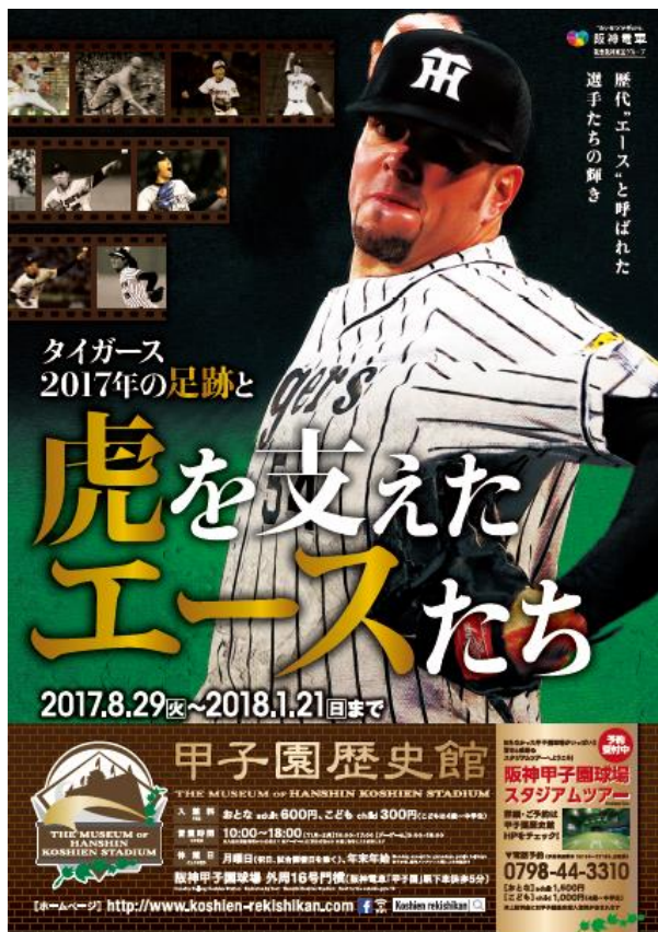
< 企画展ポスター >

◎ホームページ http://www.koshien-rekishikan.com