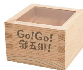
オリジナル枡のイメージ