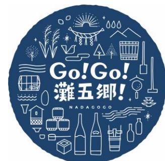
●「灘の酒蔵」活性化プロジェクトシンボルマーク (ロゴ)

日本酒、灘五郷にまつわるものをアイコン化しており、今後、関連事業やグッズの製作などで使用してまいります。