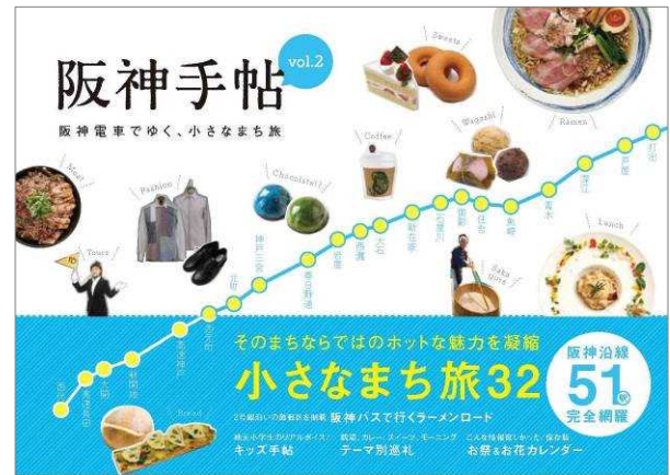
＜『阪神手帖』表紙イメージ＞

『阪神手帖vol.2 阪神電車でゆく、小さなまち旅』の概要は、別紙のとおりです。