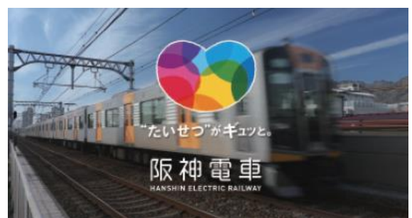
「ぼくの街の阪神電車 2017」(2017)