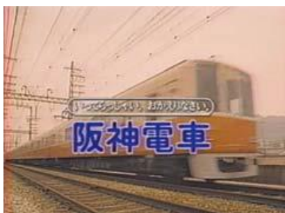
「ぼくの街の阪神電車」(1987)