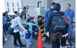
〈車両工場内と屋外会場〉