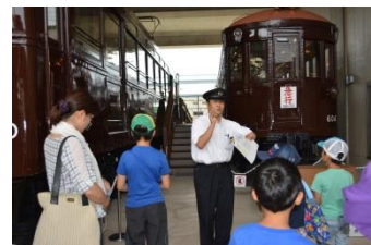
<まなび基地見学会の様子>

「はんしんまつり」では、このうち、旧型車両（601形・1141形）の見学と踏切施設での保線作業体験を実施します。