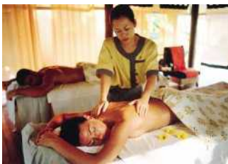
アンサナ・スパ ANAクラウンプラザホテル神戸 (ご縁コースより)