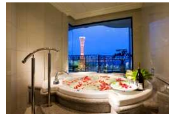
ホテル ラ・スイート神戸 ハーバーランド (絆コースより)