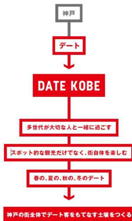
【プロジェクトの構想】

なお、デザイン・クリエイティブセンター神戸と阪神電気鉄道株式会社は、これまでも、神戸市立王子動物園から兵庫県立美術館までのエリアの地域活性化プロジェクト「神戸ミュージアムロード 美かえるカラフルプロジェクト」にも共同で取り組んでいます。