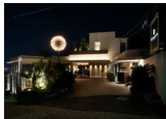
KITANO CLUB (結びコースより)