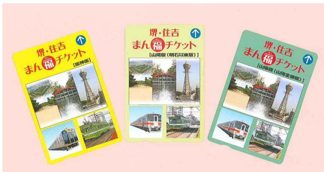
堺・住吉まん福チケッ ぶく ト阪神版・山陽版

パンフレットに掲載している堺、住吉、新世界エリアの特典施設・店舗で、同チケッ ぶく トを呈示すると、割引やプレゼントなどの特典を受けることができます。