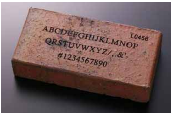
< 刻印したレンガのイメージ >