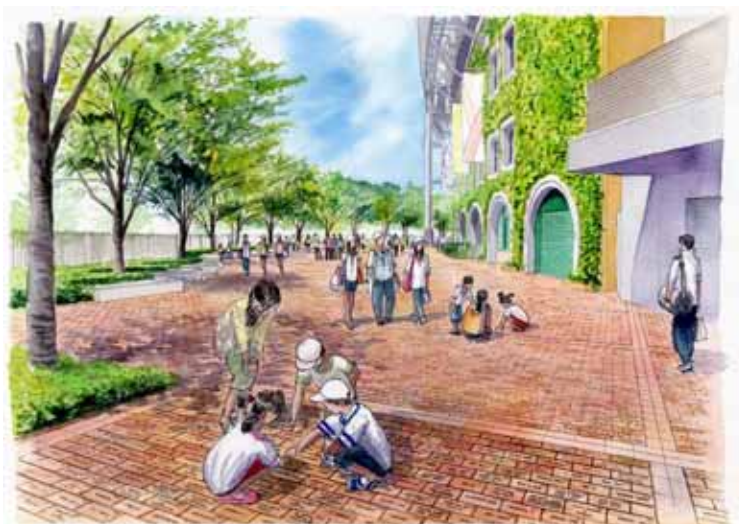
<レンガ敷設場所のイメージ>