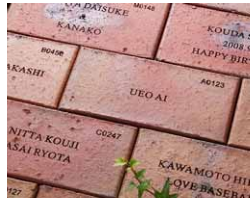
< 床面に敷設したイメージ >