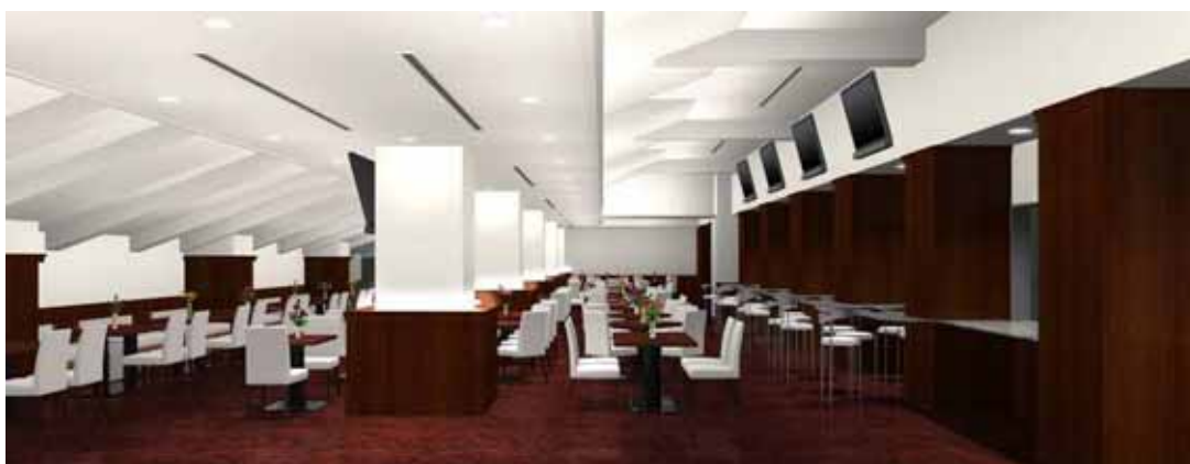
【プレミアムラウンジ内イメージ】