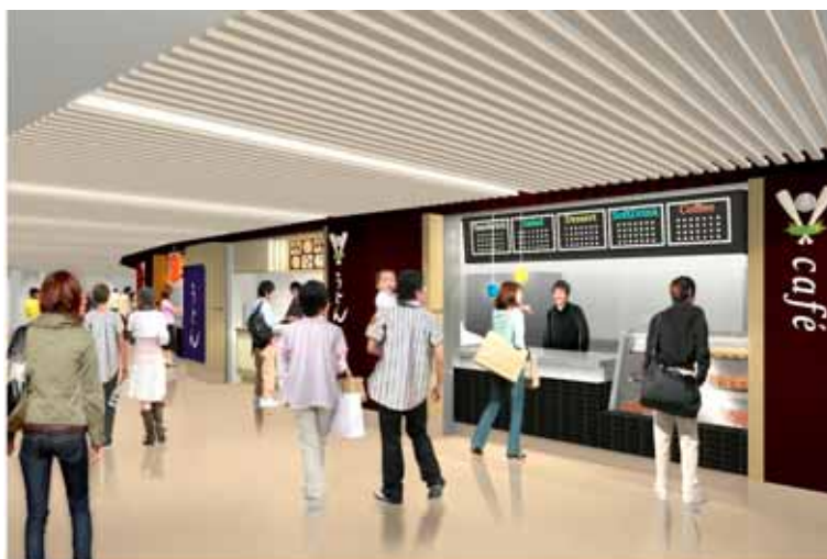
【内野飲食売店イメージ】