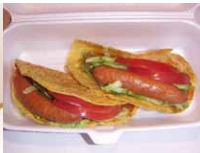
メキシカンタコス