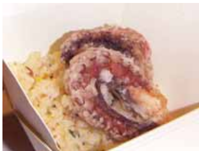
淡路産たこチャーハン

『ボルシチ』：たっぷりの野菜と肉を炒め、スープでじっくりと煮込み、サワークリームを入れて食べる、鮮やかな深紅色が特徴のボリュームあるロシアのスープ。