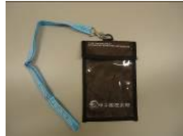
甲子園歴史館オリジナル「チケットホルダー」