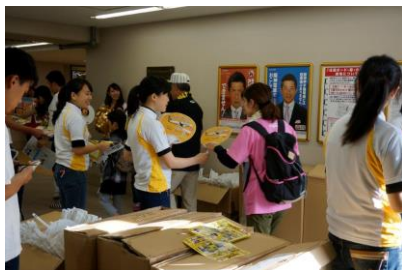
抽選付き団扇の配布 (昨年実績)