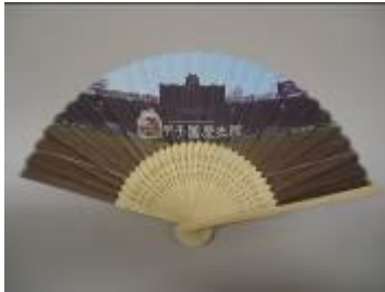
甲子園歴史館オリジナル「扇子」