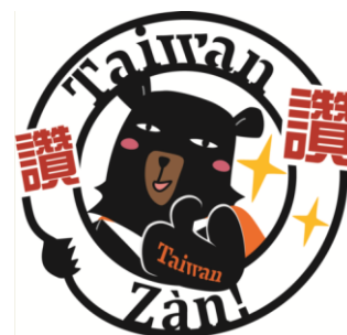
台湾観光協会ゆるキャラ喔熊(Oh!Bear)