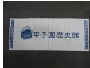
甲子園歴史館オリジナル「手ぬぐい」