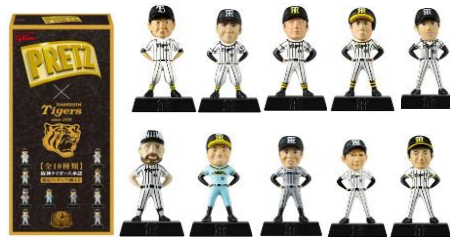
阪神タイガースオリジナルブリッツ