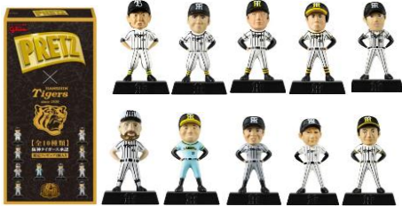
阪神タイガースオリジナルプリッツ