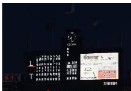
場内ビジョンで当選者の発表（昨年の様子）