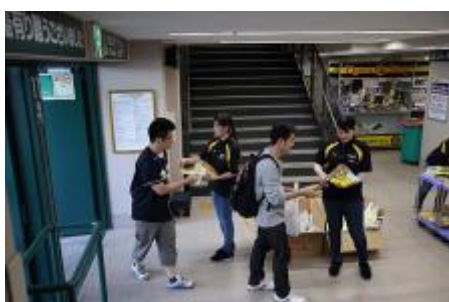
抽選付きうちわの配布（昨年の様子）