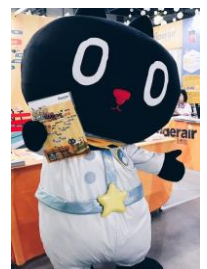
タイガーエア台湾とコラボの 新しい仲間 クロロ