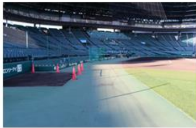
<グラウンド内マラソンコース>

阪神甲子園球場の外周及びグラウンド内（土の一部・人工芝エリア）の1周約0.9kmのコース ※安全上の理由等により、コースは予告なく変更する場合があります。