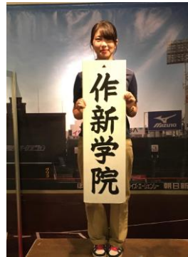
出場校名プレート (イメージ)