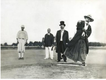
100回大会の歴史 (イメージ)