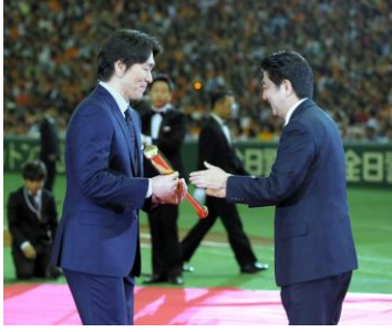
国民栄誉賞受賞時に 贈られた金のバット