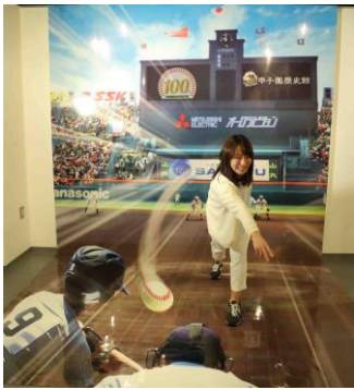
トリックアート (100回大会特別 ver)