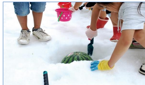
スペシャル宝さがしゲーム 開催時の様子

当日は、チューピングスライダー、雪玉ストラックアウトなどのイベントを開催しています。