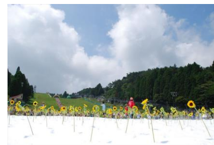
「真夏の雪まつり」開催時の様子