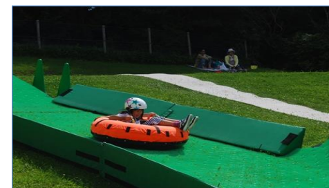
チューピングスライダー