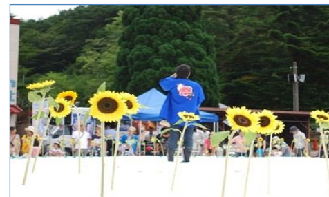
雪上ひまわり畑 開催時の様子