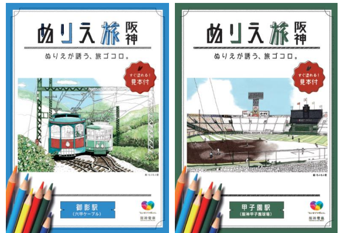
<『ぬりえ旅 阪神』表紙イメージ>

昨年12月に配布した「神戸三宮駅」版と「元町駅」版は、10日間で約2万部がなくなるなど、大好評であったことから、これをシリーズ化することとし、アンケートで塗り絵にして欲しいスポットとして人気の高かった「御影駅(六甲ケーブル)」版と「甲子園駅(阪神甲子園球場)」版の2種類を発行します。