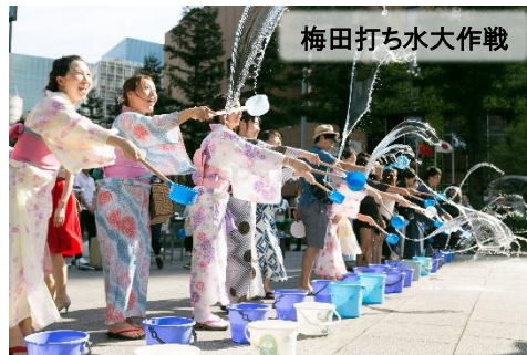
梅田打ち水大作戦

16時になると、各特設会場で一斉に打ち水が始まります。 ご参加頂いた方には体を潤す飲み物をプレゼント。