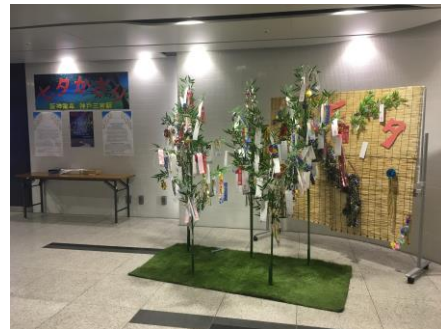
昨年の様子（東改札外イベントスペース）