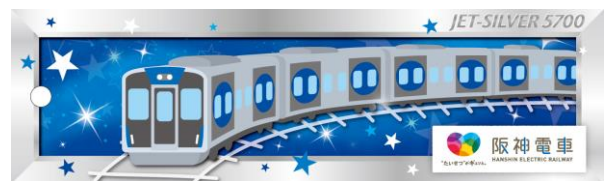
阪神電車オリジナル短冊

昨年は、神戸三宮駅で4,500枚を超える短冊が集まっており、多くの方の願いとともに、神戸の玄関口で皆さまをお迎えします。