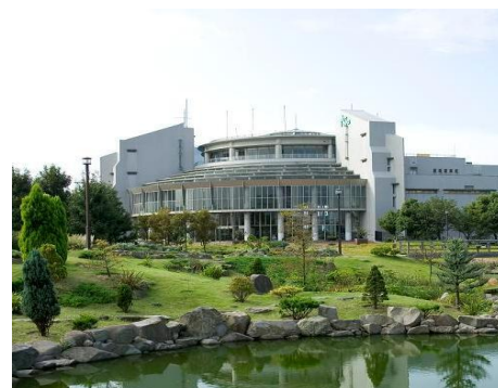
〈天然温泉かもめの湯(露天風呂)〉