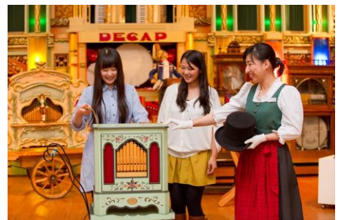
演奏体験(イメージ)