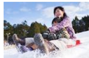
雪ゾリイメージ(左)