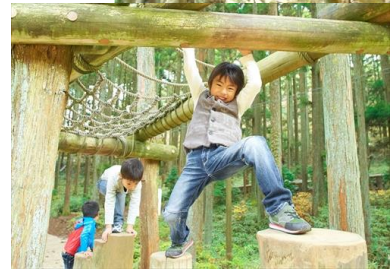
六甲山フィールド・アスレチック 場内の様子