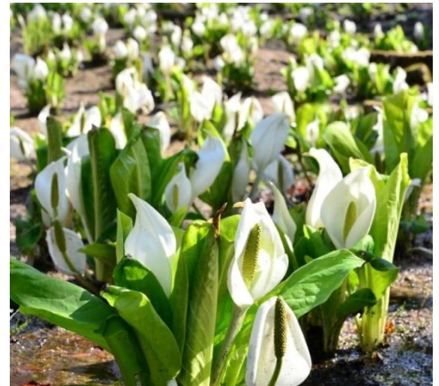
ミズバショウの群落

https://www.rokkosan.com/hana/event/cat_profit_info/1602/