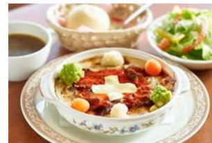
六甲山スイスフェア 期間限定メニュー(左)