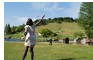
六甲山 カンツリーハウス イメージ(左)