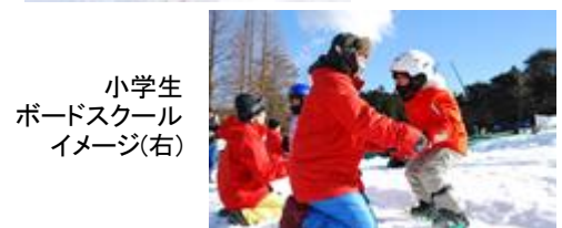
小学生 ボードスクール イメージ(右)