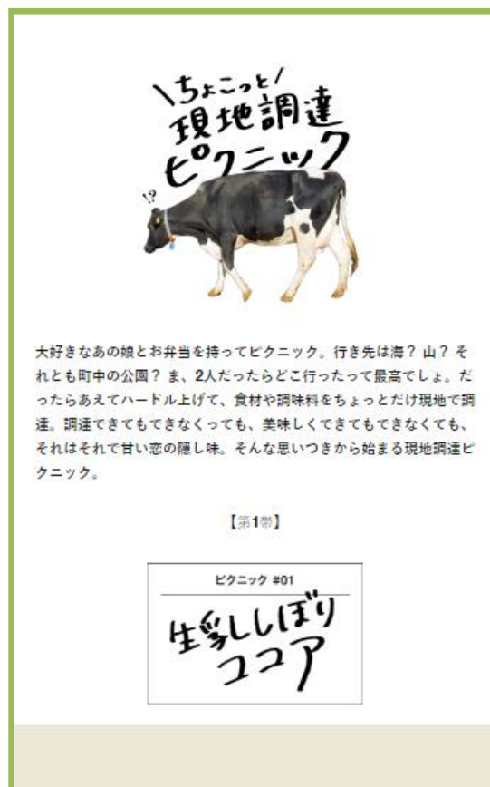
<コラム「ちょこっと現地調達ピクニック」イメージ>