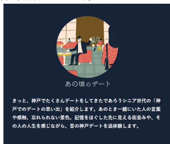
<コラム「あの頃のデート」トップ画面イメージ>