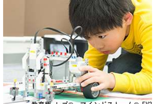
教育版 レゴ® マインドストーム® EV3