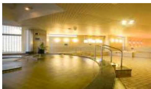
<天然温泉かもめの湯(全身浴)>