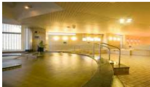
＜天然温泉かもめの湯（全身浴）＞