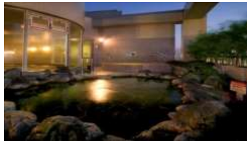
＜天然温泉かもめの湯（露天岩風呂）＞