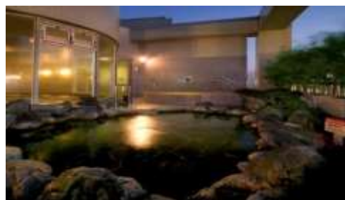
<天然温泉かもめの湯(露天岩風呂)>