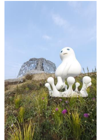
作品:さとुरさ 「あべちゃん、なんかついてるよ」 2017年 自然体感展望台 六甲枝垂れ