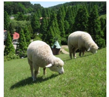
神戸市立六甲山牧場

【出展アーティスト名】 さとुरさ (メインビジュアル「あべちゃん、なんかついてるよ」の関連作品を設置予定)