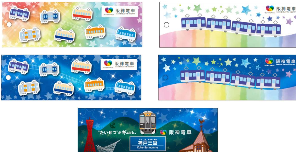
阪神電車オリジナル短冊

各施設では「date.KOBE」のロゴを配した短冊を用意するほか、神戸三宮駅では5種類の阪神電車オリジナル短冊を用意します。