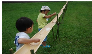
流しそうめん体験