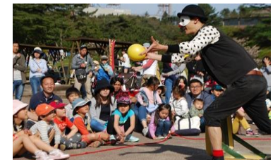
ストリート・パフォーマンスショーの様子