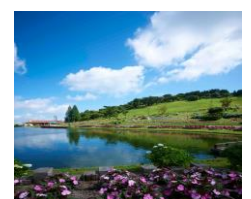
六甲山カンツリーハウス

【入園料】大人(中学生以上)620円 / 小人(4歳～小学生)310円、 ワンちゃん100円 ※ワンちゃんの入園には、一定の条件があります