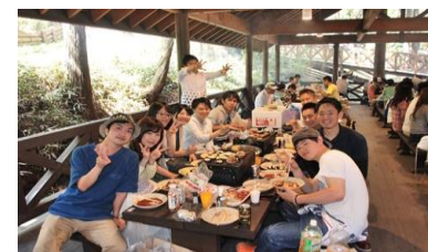
バーベキュー場 屋根付きエリア