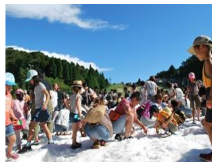
「真夏の雪まつり」開催時の様子