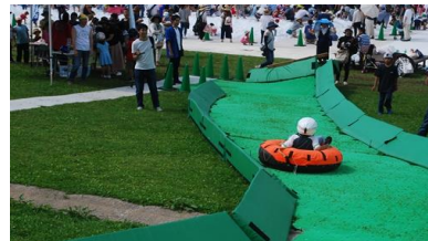
チュービングスライダー