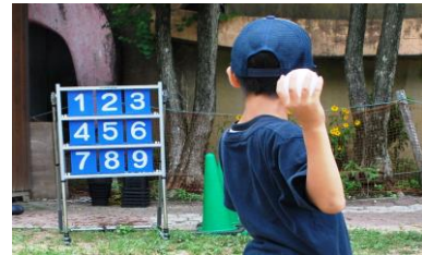
雪玉ストラックアウト