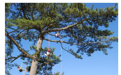
ロープクライミング