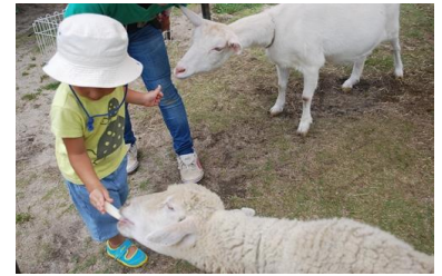
ふれあい動物ランド 過去開催時の様子