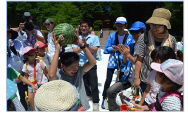
スペシャル宝さがしゲーム